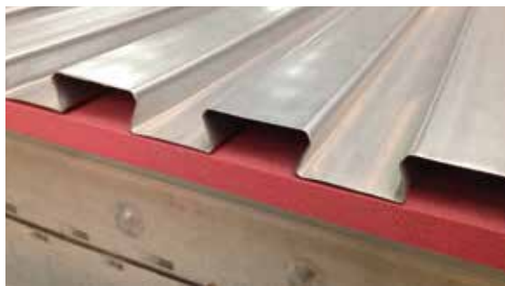
Tableau d'aide à la conception pour des planchers insonorisés LEWIS® avec SYLOMER® TSS

Pour ce faire, se référer au tableau ci-dessous, basé sur des catégories de bâtiments définies selon la norme EN 1991-1-1, tableau 6.1.